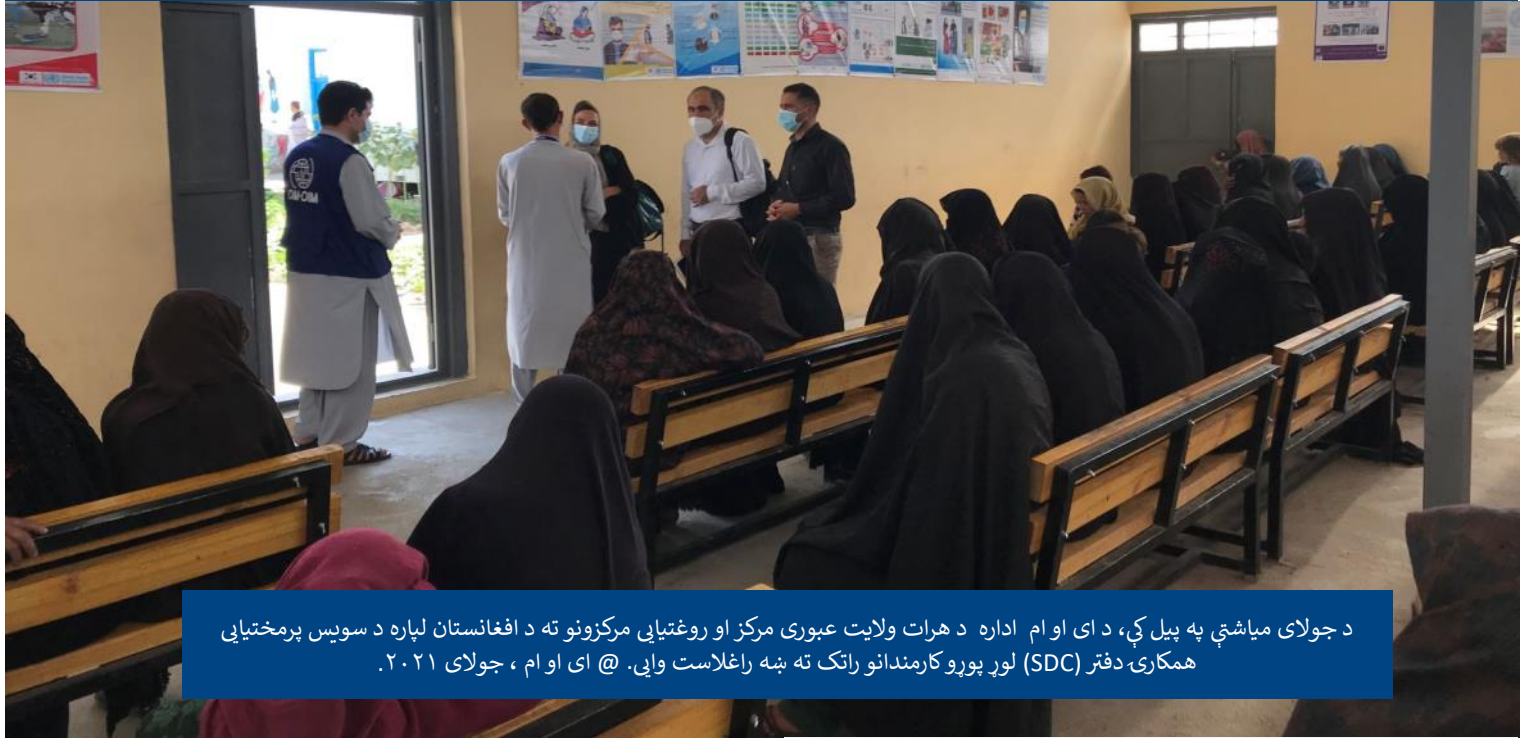
د جولای میاشتې په پیل کې، د ای او ام اداره د هرات ولایت عبوری مرکز او روغتیایي مرکزونه ته د افغانستان لپاره د سویس پرمختیایي همکارۍ دفتر (SDC) لور پورو کارمندانو راتک ته ښه راغلاست وایي. @ ای او ام، جولای ۲۰۲۱.