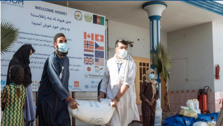
د کندهار ولايت د IOM ترانزيت مرکز کې بېرته راستنېدونکي کډوالو ته بشري مرستې چې د WFP خورواش اوډ IOM غير خورواش توکو بستې شاملې دي ترلاسه کوي، د جنوري د ۰۱ نيټې راهيسې، ۷۶۸ بي سنډه راستنېدونکي کډوال د سپين بولنگ پولې له لارې افغانستان ته راستانه شوي دي. م.م. محمد/IOM فبروري ۲۰۲۱.