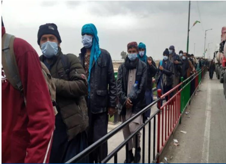
په دې وروستيو اوونيو کې، د اسلام کلا او ميلک نيمروز له لارې د کډوالو راستنېدنه په اوسط ډول نږدې ۲۰،۰۰۰ کسانو ته رسېږي، چې د جنوري او فبروري مياشتو په اوږدو کې نمونه راستنېدنه ده. پورته عکس کې د افغان کډوالو د نيمروز له لارې بيرته افغانستان ته راستنېدنه ده. ای او ام، فبروري، ۲۰۲۱

د تېرې اوونۍ په جريان کې له پاکستان څخه ۳۲۷ پي اسناده افغان کډوالو راستانه شوی دي چې ددې جملې څخه ۹۶٪ (۳۱۳ وگړو) سره مرسته شوی ده.