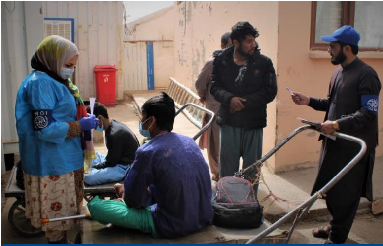
د IOM د مهاجرت روغتیایي ټیمونه د رارسیدو وروسته سکریټک کول، لومړني اساسي خدمات د وړیا درملو سره چمتو کول، او د هیواد په کچه د دریم روغتون همکارانو ته د پرمختللي پاملرنې ته راجع کول په شمول د سویل لویدیځ نيمروز ولایت کې چیرې چې د روغتیايي خدماتو وړاندې کول ورځ تر بلې د فشار لاندې دي. @ای او ام، اپریل ۲۰۲۱.

د تیرې اوونۍ په جریان کې له پاکستان څخه ۳۳۸ یې اسناده افغان کډوالو راستانه شوی دي چې ددې جملې څخه ۹۷٪ (۳۲۷ وگړو) سره مرسته شوی ده.