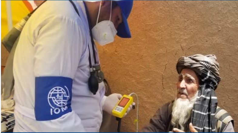
د لایف باکس خصوصي سکټور مرستو تر چتر لاندې په کندهار ولایت کې د ای او ام ادارې روغتیايي کارمندان د اکسیجن د اشباع په خاطر دمریضانو د نبض اکسیمېتر په کارولو پرته د سنتې کارولو یا د وینې نمونې اخیستلو پرته د ناروغ د اکسیجن سنټریت کچه اندازه کوي. @ ای او ام، جون ۲۰۲۱