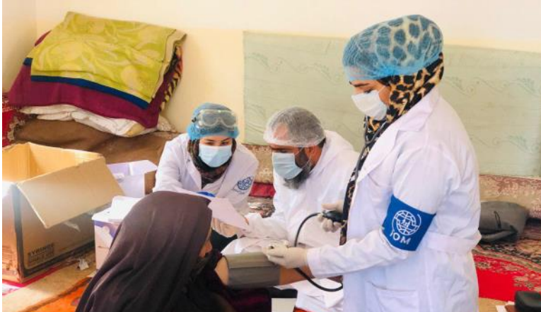
د IOM د ۵ چټک غبرگون ټيمونو (RRT) د هرات ولايت راضي ښار گوټي کې د داخلي بېخايه شويو ته لومړني روغتيايي سلامتوري او د کويد-۱۹ سکرينينگ ترسره کوي. د IOM د چټک غبرگون ټيمونه په هرات کې د ټولو نمونو ۹۰٪ څخه پورته نومونې جمع کوي. @ IOM فبروري ۲۰۲۱.