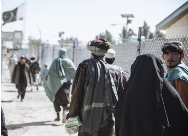
په تیره اوونۍ کې د نوي کال څخه د مخه د راستنېدونکو شمېره د ۳۰۰،۰۰۰ څخه زيات وو چې دا په ۲۰۲۱ کال زیاترینه ارقام دی. موسی محمد/ ای او ام/ مارچ/ ۲۰۲۱