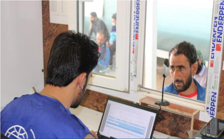
ای او ام اداره هره ورځ په ننګرهار، کندهار، نیمروز او هرات ولایتونو د سرحد په ترازیت او هرکلی مرکز کې افغان کډوالو د کډوالو د سکریټنگ او مرستې سیستم کې راجسټر کوي. د جنوري ۲۰۲۱ راهیسې تر دې دمه د ۵۰،۰۰۰ څخه ډیر افراد ثبت کړي دي. @ ای او ام، اپریل ۲۰۲۱.

د تیرې اوونۍ په جریان کې له پاکستان څخه ۳۰ په اسناده افغان کډوالو راستانه شوی دي چې ددې جملې څخه ۱۰۰٪ (۳۰ انفرادی وگړي) (۱۷ نارینه او ۱۳ ښځینه) سره مرسته شوی ده.