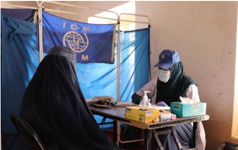
د IOM گرځنده روغتیا تیمونه د کندهار په ولایت کې د بې ځایه شویو سیمو کې د ماشوم او میندو د ملاتړ په شمول لومړني روغتیايي خدمات وړاندې کوي، د بیدخانه، د نوي تمویل رسیدلو پرته، د IOM د ساحوي روغتیايي تیمونو څخه نیمايي به د جون په ۲۰۲۱ ونړي. @ام، اپریل ۲۰۲۱.

د تیرې اوونۍ په جریان کې له پاکستان څخه ۸۵ پي اسناده افغان کډوالو راستانه شوي دي چې ددې جملې څخه ۹۹٪ (۸۴ وگړو) سره مرسته شوي دي.