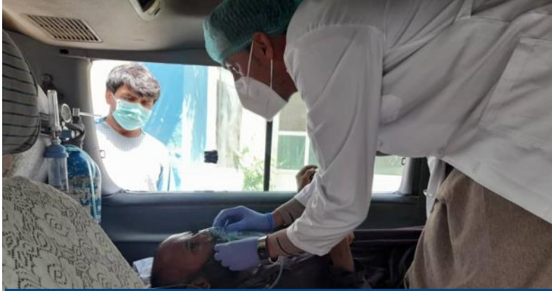
پورته، د کندهار په ولايت کې د IOM يو ډاکټر د درملني مرکز ته د کرونا جدي ناروغ په ورلو کې مرسته کوي. د کويټ ۱۹ قضيو د ورځني ریکارډ لوري کچې ته رسيدلې کوم چې ۱۵۰۰۰-۲۰۰۰ ترمنځ دی چې د ۸۰-۱۰۰ ترمنځ رسمي د مړينې شمير اعلانېږي. اټکل کېږي چې په دې ارقامو کې په د پام وړ زياتوالی په راتلونکو ورځو او اونیو راشي، د امنیت خرابوالی او ليری پروتو او کلیوالي سيمو ته لاسرسی د ټیست ورکولو محدود ظرفیت رښتیني ورځني مجموعی ارقام احتمالاً ډیر لور وي.