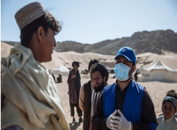
د کندهار ولایت ډنډ ولسوالۍ کې د IOM روغتیايي برخې ټیم د ۷۰۰ څخه زیاتو د جنگ له امله بې ځایه شویو کورنیو ته لومړني صبحي خدمات او د کویډ-۱۹ په اړه عامه پوهاوی تر سره کړی دی. @ موسی محمد/ای او ام، فبروری ۲۰۲۱

همدارنګه د خونديتوب ټیم د افغانستان د خونديتوب کلسټر په همکارۍ د کویټ ۱۹ منظم نظارت سروې ترسره کوي پدې اوونۍ کې ۱۴۹ کورنیو سروې شوې، چې ټولو د WHO لخوا تایید شوي معلومات او د عامه پوهاوی او د خطراتو کمولو بیغامونه کویټ ۱۹ په تړاو پوهاوي ترسره شوی دي.