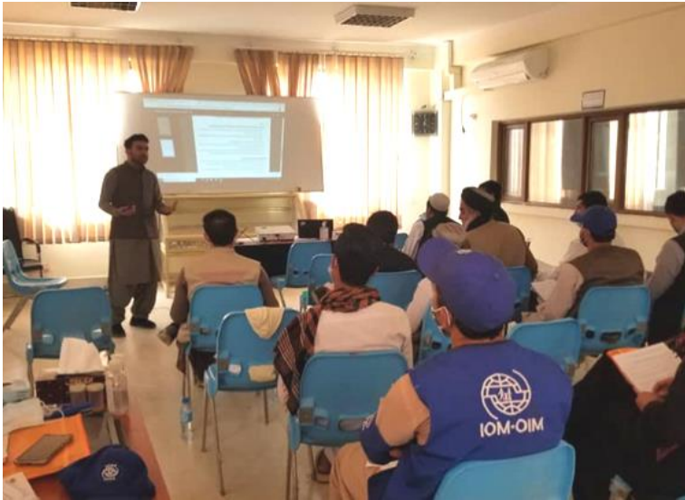
د ای او ام ادارې کډ عملیاتی اصول (IOPs) روزنیز ورکشاپ دولتي او اړوند اداراتو لپاره په هرکلی او عبوري مراکزو کې دوام لري. دغه روزنیز ورکشاپ په شخړو کې د ښکېلو خواو سره د ښکېلتیا لپاره د پالیسیو او کړنلارې په بر کې نیسی، وروستیې ترېننگ په ۲۲ مارچ ۲۵ کارمندانو ته په کندهار کې په لاره اچولې وو. @ای او ام، مارچ ۲۰۲۱.

د تیرې اوونۍ په جریان کې له پاکستان څخه ۴۹۳ پي اسناده افغان کډوالو راستانه شوی دي چې ددې جملې څخه ۹۸٪ (۴۸۵ وګړو) سره مرسته شوی ده.