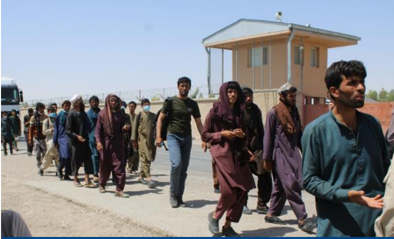
په ۲۰۲۱ کال کې د ۴۷۰،۰۰۰ څخه زیات افغانان یوځای په پنځو میاشتو کې د ایران څخه راستانه شوی چې ۱۷۰،۰۰۰ څخه زیات یې په ورته وخت په ۲۰۲۰ کال کې چې نږدې ۲۰۰،۰۰۰ د سویل لویدیځ ولایت نیمروز چیرې چې د بشردوستانه ملگرو شتون خورا محدود دی راستانه شوی دی. @ ای او ام، اپریل ۲۰۲۱.

د تېري اوونۍ په جریان کې له پاکستان څخه ۳۸۱ بي اسناده افغان کډوال راستانه شوی دي چې ددې جملې څخه ۱۰۰٪ (۳۸۱ انفرادی وگړي) چې (۱۹۳ نارینه او ۱۸۸ ښځينه) سره مرسته شوی ده.