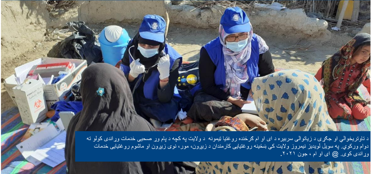
د تاوتریخوالي او جګړې د زیاتوالي سربیره د ای او ام ګرځنده روغتیا ټیمونه د ولایت په کچه د پام وړ صحیې خدمات وړاندې کولو ته دوام ورکوي. په سویل لویدیځ نیمروز ولایت کې ښځینه روغتیايي کارمندان د زیږون، مور، نوی زیږون او ماشوم روغتیايي خدمات وړاندې کوي. @ ای او ام، جون ۲۰۲۱.