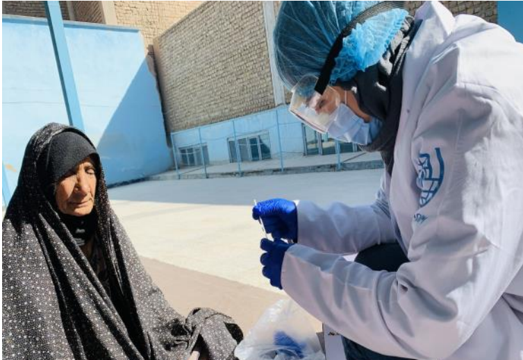
د IOM د جیک غبرګون ټیمونه په ټولنو کې کار کوي ترڅو د کوید-۱۹ لپاره د نظارت ملاتړ او د روان کوید-۱۹ تېسټ کونه حمایت کړي. د مارچ په میاشت کې، د هرات په ولایت کې، د جیک غبرګون ټیمونو ۲۵۷۲ کسانو څخه نمونه اخیستې وی چې ۵۴۶ کسان په کې مثبت وو. په هغو سیمو کې چې IOM فعالیت کوي، د ۲۱٪ زیات د تېسټ نتيجه مننښت وي. د پراخې ازموینې پایلې په نتیجه کې د مارچ میاشتنۍ په جریان کې په هرات کې د مثبتوالي کچه ۲۸٪ وه. @ای او ام، مارچ ۲۰۲۱

د تېرې اوونۍ په جریان کې له پاکستان څخه ۳۶۸ بی اسناده افغان کډوالو راستانه شوی دي چې ددې جملې څخه ۹۹٪ (۳۶۶ وګړو) سره مرسته شوی ده.