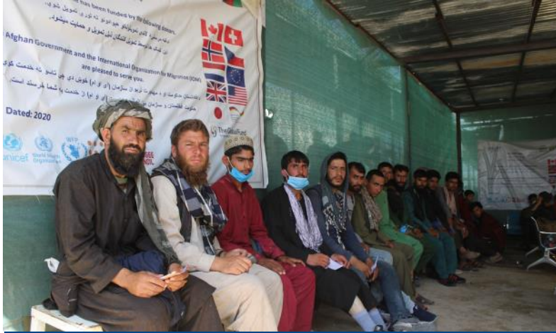
په ۲۰۲۱ کال کې د راستنېدونکو کډوالو شمیر د نیم ملیون څخه زیات دی، په ځنګ کې زیاتوالی، د دوامداره کار موندونې او خدماتو په شمول د روغتیایي پاملرنې ته نه لاسرسی په سیمه او منطقه کې د کډوالی اصلی فکتورونو څخه شمیرل کېږي. @ ای او ام، می ۲۰۲۱.

د تیرې اوونۍ په جریان کې له پاکستان څخه ۳۵۳ پي اسناده افغان کډوال راستانه شوی دي چې ددې جملې څخه ۹۵٪ (۳۳۶ انفرادی وگړي) چې (۱۷۴ نارینه او ۱۶۲ ښځینه) سره مرسته شوی ده.