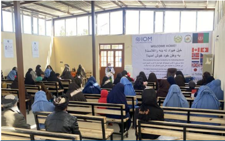
د IOM د مهاجرت روغتيا ټيم په هرات ښار د کنزركه ترانزيت مرکز کې بېرته راستنېدونکو او کوربه ټولني غړو ته لومړني روغتيايي زده کړي او د کووید ۱۹ مخنيوي په اړه عامه پوهاوي غونډې ترسره کړي دي. IOM جنوري ۲۰۲۱