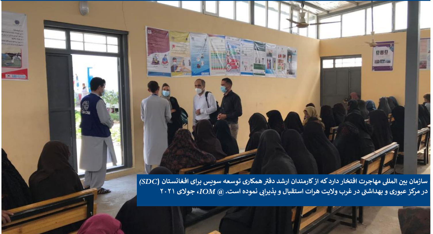
سازمان بین‌المللی مهاجرت افتخار دارد که از کارمندان ارشد دفتر همکاری توسعه سوئیس برای افغانستان (SDC) در مرکز عبوری و بهداشتی در غرب ولایت هرات استقبال و پذیرایی نموده است. IOM @، جولای ۲۰۲۱