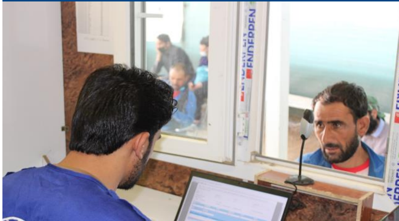
دفتر آی او ام در مرکز پذیرای عبوری ولایت کندهار، هرات، ننگرهار و نیمروز روزانه مهاجرین افغان را در سیستم (BSAF) راجستر مینمایند. از جنوری تا الحال به تعداد ۵۰،۰۰۰ افراد در این سیستم راجستر شده است. IOM، می ۲۰۲۱.

برنامه محافظتی IOM در جریان سال ۲۰۲۱ به تعداد ۱،۴۹۰ (۹۵۲ زن، ۸۴۶ مرد، ۲۹۷۱ دختر و ۳۴۲۰ پسر) قضیه شامل کتگوری افراد با نیازمندیهای مشخص را بوسیله ارائه اطلاعات به موقع، تسهیل مطمئن و با عزت دسترسی به خدمات و ارائه کمک های دیگر از جمله پول نقد برای کاهش خطرات حفاظتی شناسایی شده و جلوگیری از اثرات منفی هنگام مسدود شدن راه های رجعت دهی، کمک نموده است. تیم های حفاظتی در نقاط مرزی که مصروف غربالگری قضایا اند در هرات و نیمروز و همچنان به همکاری کارمندان ولایتی در ۱۱ ولایت توانسته است که ۷۳ قضیه (۹۲ زن، ۹۶ مرد، ۱۷۴ دختر و ۱۸۰ پسر) از جمله ۲۸ طفل و ۱۲ زن و ۱۳ کهن سال در معرض خطر، ۲۰ تن در شرایط جدی پزشکی، ۸ تن معیوب، ۶ والدین مجرد و ۴ طفل جدا شده را در ولایات نیمروز، کندز، کابل، غور، فاریاب، تخار، هرات، بلخ و کندهار تحت نظارت و ارزیابی قرار دهند. ۷۷۵ مورد دیگر همراه خانواده های شان در مرز های میلک ولایت نیمروز و اسلام قلعه ولایت هرات توسط کارمندان تیم محافظتی به همکاری ریاست مهاجرین شناسایی شده اند. ۱۶ خانواده عودت کننده (۱۶ زن، ۱۴ مرد، ۱۷ دختر و ۲۳ پسر) کمک های پس از عودت (مشمول میابیل، ردیابی فامیل ها و حمل و نقل) دریافت نمودند، ۲۵۶ تن کمک های مالی دریافت نموده و ۷۳ قضیه دیگر مورد ارزیابی مدیریتی این تیم قرار گرفته اند.