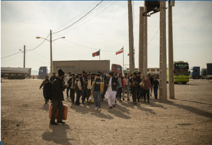
له ايران څخه شړل شوي (ويستل شوي) وگړي اسلام قلعي ته در را رسيدو وروسته د اني ار سي په واسطه د جور شوي عبوري کمپ د باندي، چيرته چې به نوموړي وگړي هرات ښار د ليرد تر مخه د افغانستان دولت لخوا لمړي ثبت او بيا به دکډوالۍ نړيوال سازمان ته د مرستو په پار راجع شي.