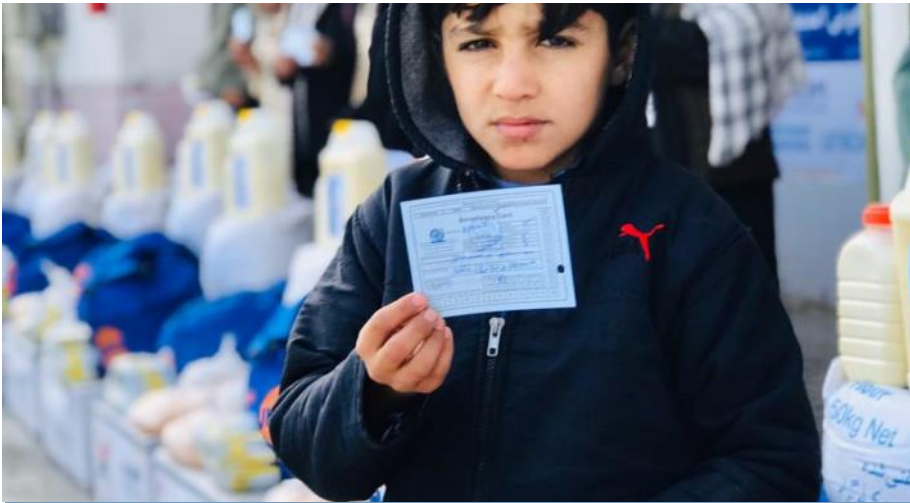
طفل عودت کننده در حال دریافت کمک، در مرکز ترانزیت ولایت قندهار.

۱ فبروری ۲۰۲۰ بازگشت نمودند که ۹۴٪ آنان (۱۵۰ تن) کمک شده است.