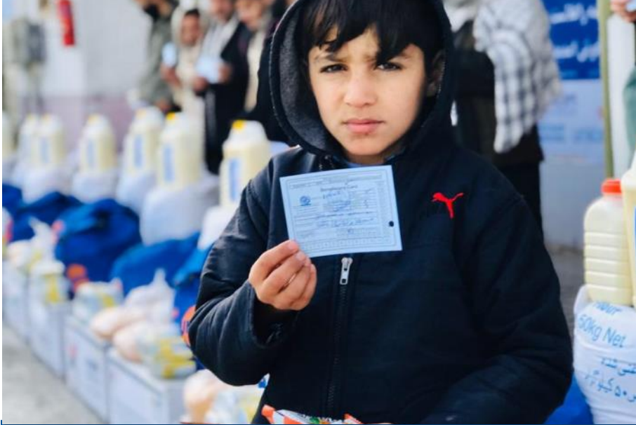
يو راستنېدونکې ماشوم د کندهار عبوري کمپ (ترانزيت) کې مرسته ترلاسه کوي .