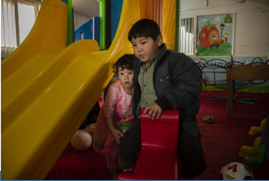
له ايران څخه د راستنېدو وروسته، بېرته راستانه شوي ماشومان په نمبروز كې د ماشوم دوستانه ځای كاروي.