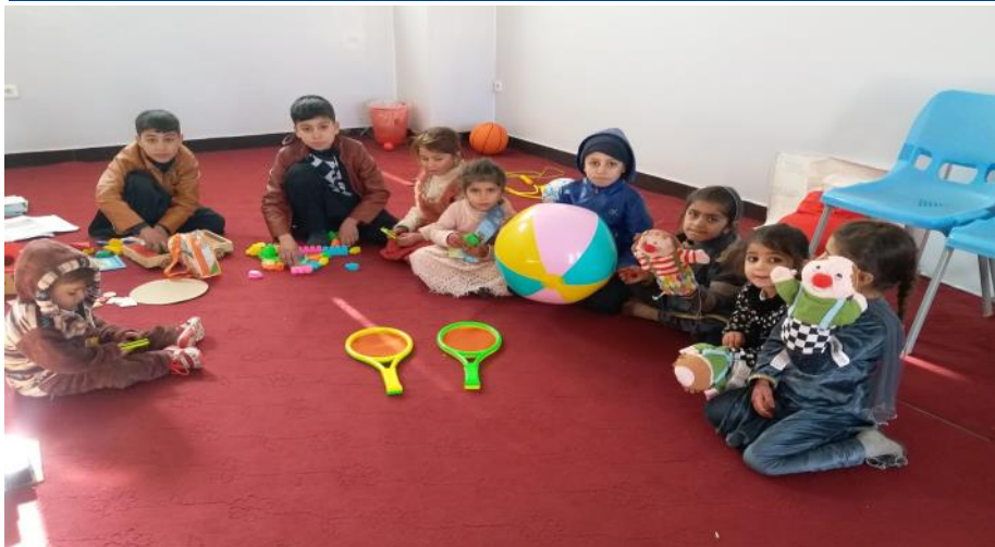
اطفال برگشت نموده در محیط دوستانه اطفال، در مرکز ترانزیت تورخم.