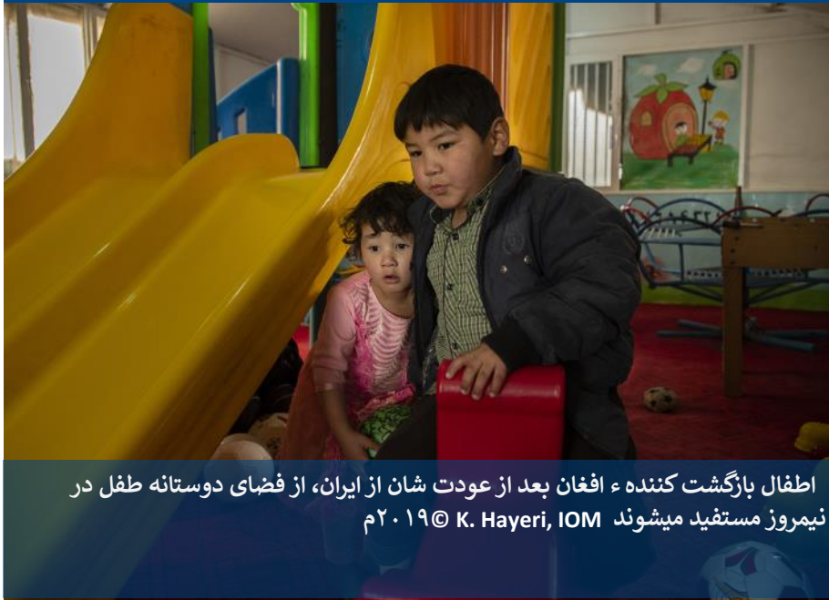
اطفال بازگشت کننده ء افغان بعد از عودت شان از ایران، از فضای دوستانه طفل در نیمروز مستفید میشوند